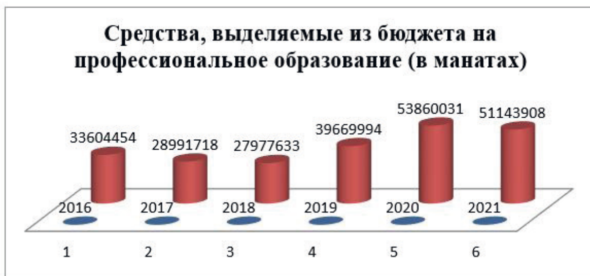
Рис. 3. Динамика бюджетных расходов на профессиональное образование