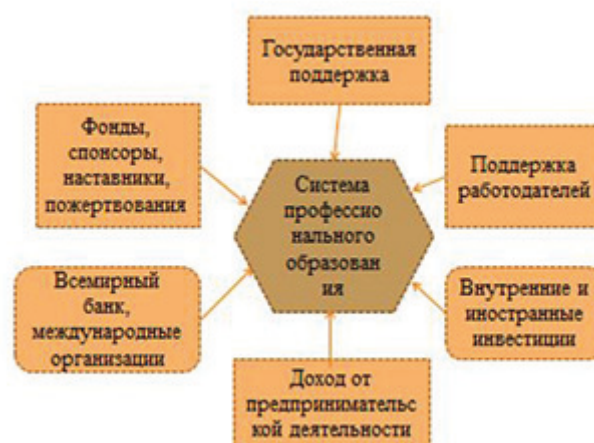
Рис. 4. Финансовые источники системы профессионального образования Fig. 4. Financial sources of the vocational education system

Чтобы добиться развития профессионального образования в Азербайджане на желаемом уровне, важно привлечь к этой работе различные источники финансирования. Возможные источники финансирования системы профессионального образования можно представить следующим образом.