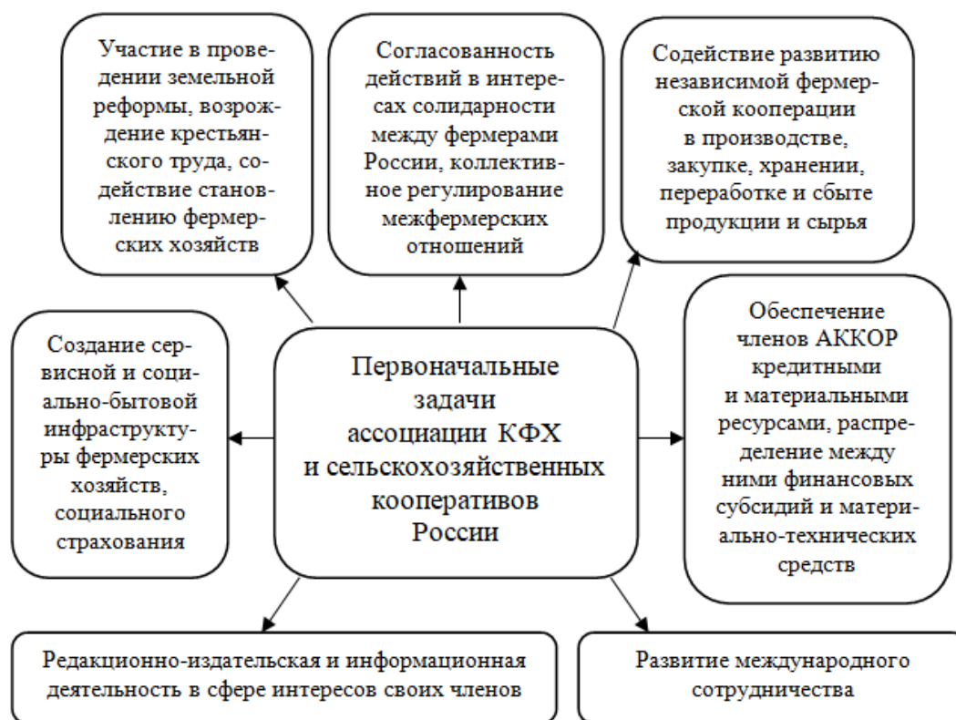
Рис. 2. Первоначальные задачи АККОР [11] Fig. 2. Initial tasks of AKKOR [11]

Важно отметить, что на протяжении всего развития кооперативного движения во всем мире существуют две противоположные позиции, выражающие взгляды на цели, задачи и стратегии создания и функционирования кооперативов. Сторонники первого направления рассматривают особую социальную роль кооперации, когда приоритетом становятся интересы членов кооператива, общее социальное и экономическое благополучие сообществ [5]. Наиболее ярким примером социальной модели кооперации является кооператив La Nuova Arca, созданный в Италии в рамках инициативы «Солидарное сельское хозяйство». Кооператив специализируется на выращивании органической продукции, при этом годовой валовой доход составляет около 120 000 евро, из которых 60 % приходится