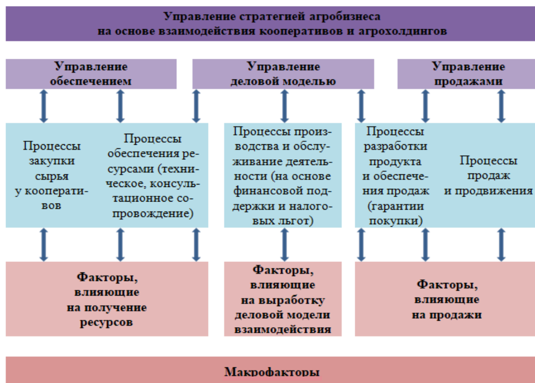
Рис. 3. Элементы управления стратегией агробизнеса на основе взаимодействия кооперативов и агрохолдингов