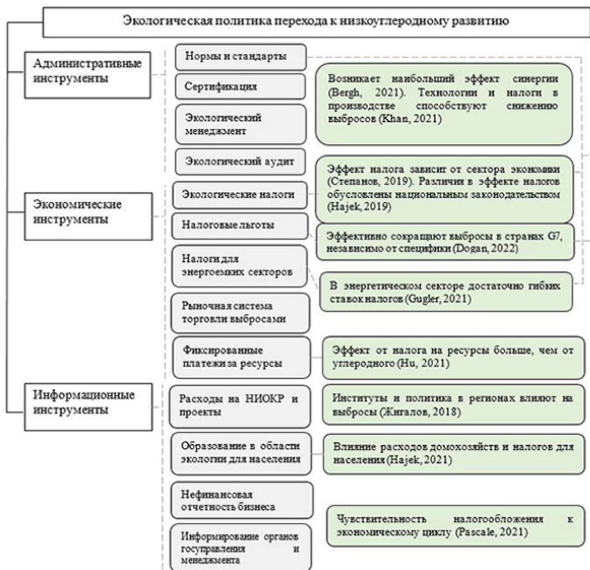
Рис. 1. Инструменты государственной политики в области снижения генерируемых выбросов углерода