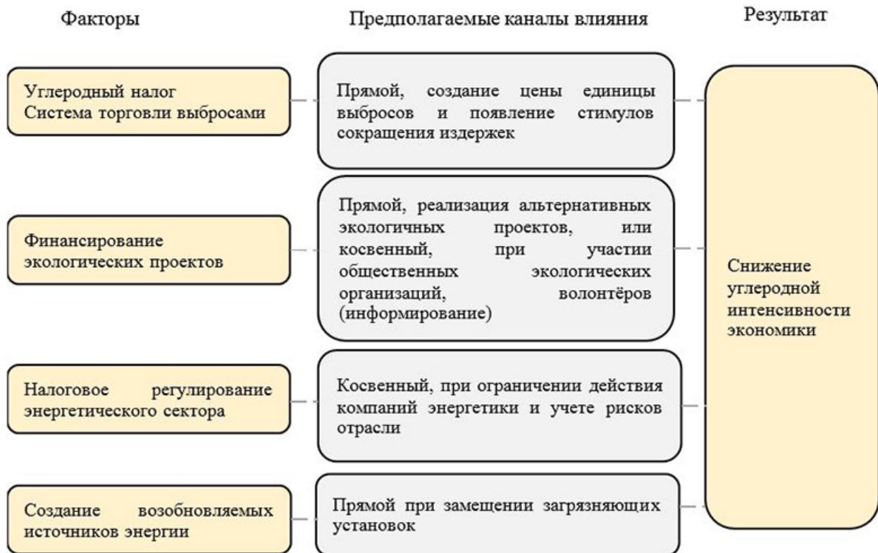
Рис. 3. Результаты исследования.