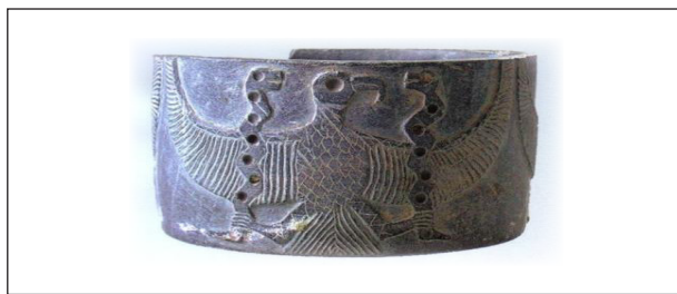
Рис. 3. Цивилизация Джирофт, одноглавый орел посуда из талькохлорита

Орел — благородная, умная, стремительная и высоко парящая птица, превосходящая остальных пернатых своей величием и способностями, и его место — рядом с царями.