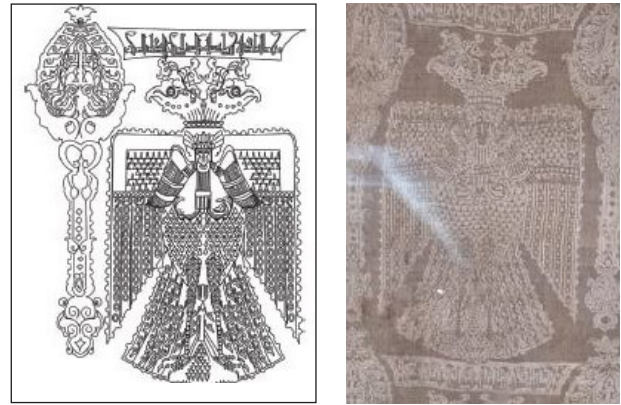
Рис. 8. Ткань с двуглавым орлом, хранящаяся в Национальном музее Ирана

Факторы, повлиявшие на изображение двуглавого орла в иранской культуре доисламского периода, можно обнаружить в мифологии, религии, народных верованиях и литературе. В иранской мифологии двуглавый орел символизирует таких легендарных птиц, как Хума (рис. 10) и Симург (мифологическая птица, обозначающая тридцать птиц, рис. 11), а также является символом Митры (Мехра). Варгана — священная птица в Авесте, играет важную роль в похоронных ритуалах, тем самым представляя идеи загробного мира, бессмертия и спасения. Она