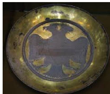
Рис. 7. Серебряная тарелка с символом двуглавого орла (период Сасанидов)