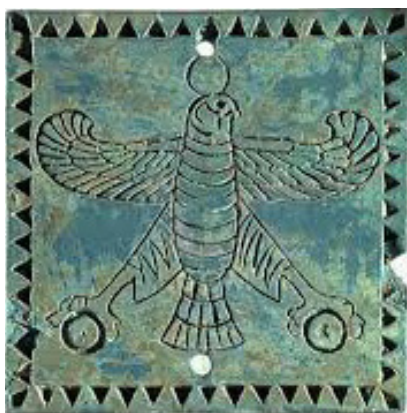
Рис. 5. Плитка с орнаментом орла (период Ахеменидов)

Изображения орла на лурестанской бронзе символизируют небесную мощь. В митраизме орел выступает как символ птицы Солнца, связанный с планетой Марс (رسولی، 1389: 118 موسوی). Иранцы называли эту могущественную птицу «Шахин» — от слова «шах», означающего «королевский», что само по себе говорит о ее связи с королевской властью.