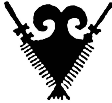
Рис. 2. Тали-Бакун.

Fig. 1. The Achaemenid seal depicts Anahita (the patroness of waters) standing on the back of a lion with the sun above her head.