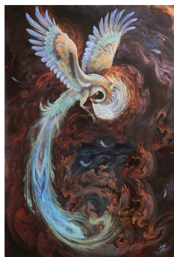
Рис. 10. Изображение Хумы