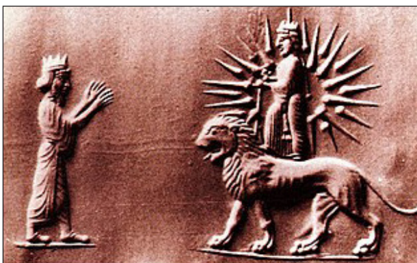
Рис. 1. На печати Ахеменидов изображена Анахита (покровительница вод), стоящая на спине льва с солнцем над головой.

В III тысячелетии до н. э. двуглавый орел интерпретировался как символ и «царский знак отличия». Он ассоциировался с Лагашем, вавилонским богом плодородия, бури и войны. Эмблему двуглавого орла встречаем и у Хаттов (514 :1386 (وارنز,)). До 2003 г. археологи полагали, что начало формирования символа двуглавого орла принадлежит хеттской цивилизации (XIII в. до н. э.), который позже вновь появился у турков-сельджуков (королевской династии после принятия ислама в Иране, с 1037 по 1194 гг.) в средние века, и европейцы позаимствовали его у сельджуков во время кре-