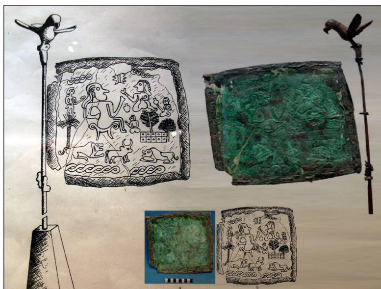
Рис. 12. Первый железный флаг мира – Флаг Шахдад (Музей древности Ирана)