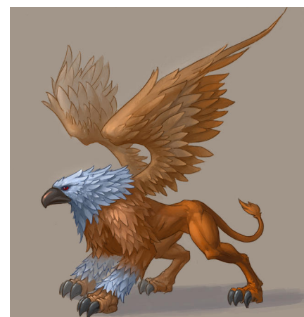
Рис. 11. Изображение Симурга. Художник: Фархад Рафи