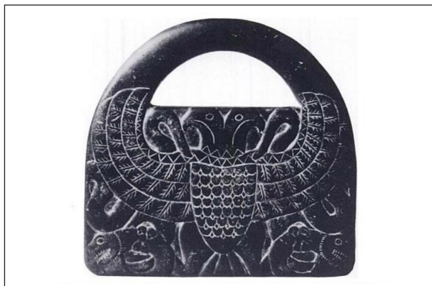
Рис. 4. Цивилизация Джирофт, двуглавый орел посуда из талькохлорита