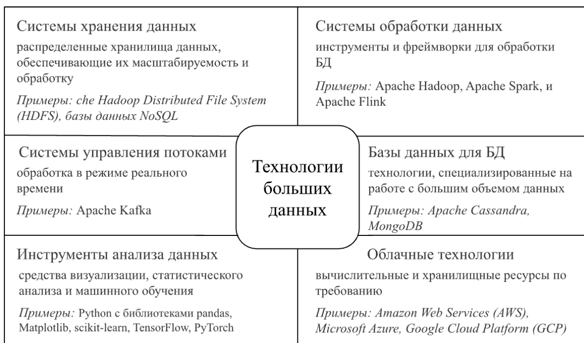
Рис. 1. Технологии больших данных

Особую важность в контексте развития ЭД имеют инфраструктурные возможности, предоставление которых оказывается в первую очередь в ведении региональных властей: прогнозирование нагрузки и конкретных составляющих инфраструктуры для развития актуального этапа цифровой трансформации в условиях бюджетного процесса становится одной из первоочередных