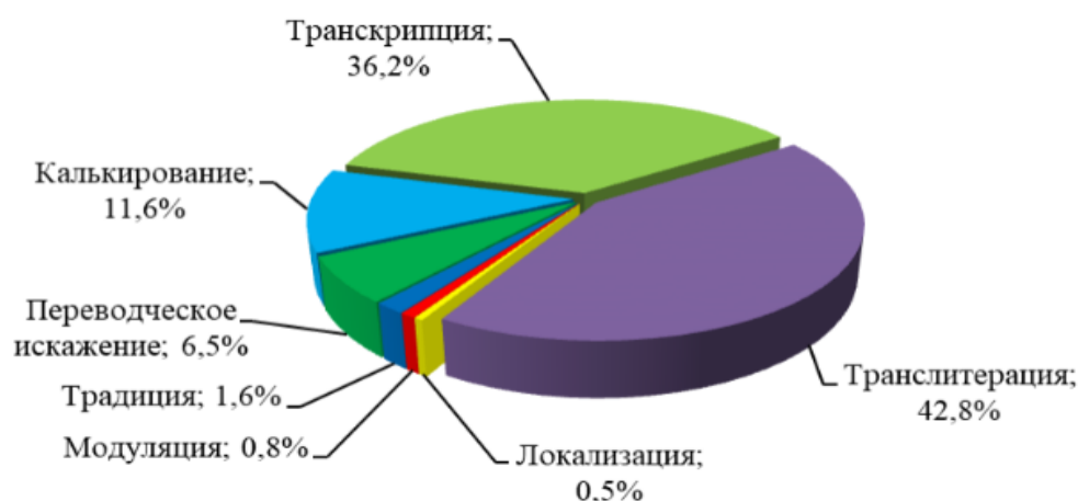
Рис. 2. Переводческие трансформации и варианты перевода антропонимов в видеоиграх Fig.2. Transformations and variants of anthroponyms translation in videogames