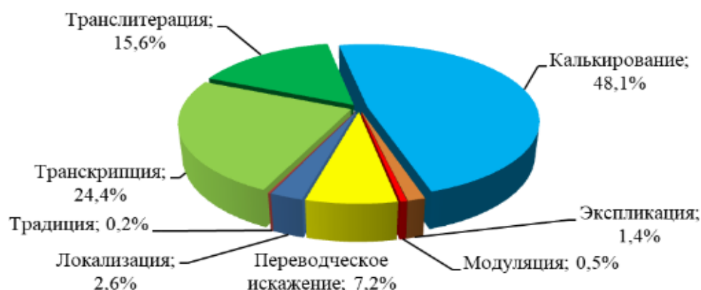
Рис. 1. Переводческие трансформации и варианты перевода топонимов в видеоиграх Fig. 1. Transformations and variants of place names translation in videogames

Как и топонимы, которые дают характеристику местности, используя фонетические особенности уже существующих языков, чтобы у игрока возникла ассоциация с определенной реальной страной, регионом и культурой, антропонимы используются в видеоиграх с той же целью. Например, в видеоигре «The Witcher 3: Wild Hunt» польской студии CD Projekt RED существует персонаж Marcello Clerici , расположенный в локации Туссент, образ которой основан на Испании, Италии и Франции. В случае с указанным антропонимом эта информация помогла российским локализаторам подобрать верную переводческую трансформацию (было использовано транскрибирование, при помощи которого переданы особенности фонетики итальянского языка), чтобы получить имя Марчелло Клеричи .