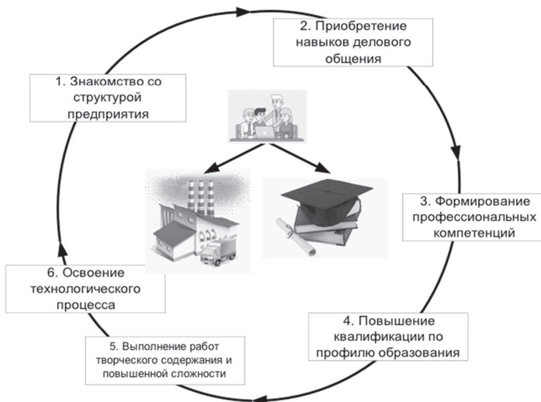
Рис. 2. Задачи обучаемых при прохождении стажировки в организациях