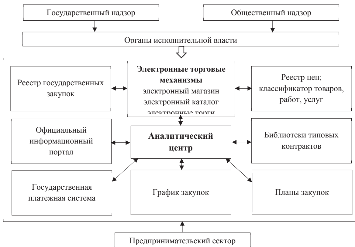
Рис. 2. Схема построения современной системы государственной закупочной деятельности в Республике

формироваться политика государственных закупок, наиболее приемлемым способом повышения эффективности деятельности является обращение Республики к зарубежному опыту, в частности попытка ориентирования на информатизацию государственного управления.