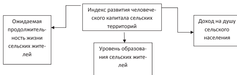
Рис. 1. Компоненты индекса развития человеческого капитала сельских территорий

На основании исследований становления, формирования и развития человеческого