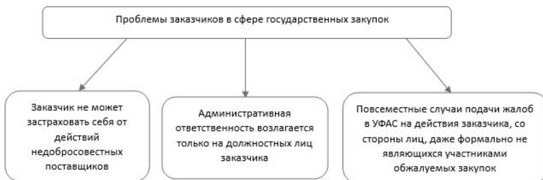
Рис. 3. Проблемы заказчиков в сфере государственных закупок

Важно также обозначить ряд проблем, с которыми сталкиваются заказчики в сфере государственных закупок (рис. 3).