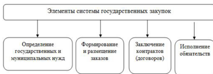
Рис. 1. Элементы системы государственных закупок

нятые решения; нет навыков оценки действий во внештатных ситуациях, принятия нестандартных решений, поскольку курсы в 24 часа не дают достаточного количества информации и не проводят практических занятий, на улучшение и укрепление навыков и знаний. Исходя из этого, разработка нормативной базы для увеличения часов преподавания и закрепление на законодательном уровне квалификационных требований для сотрудников служб снабжения и контрактных управляющих, руководителей отделов закупок является важным и в данный момент более чем своевременным решением, так как процедура проведения и организации государственных закупок — это самый сложный процесс, который включает в себя различные элементы (рис. 1).