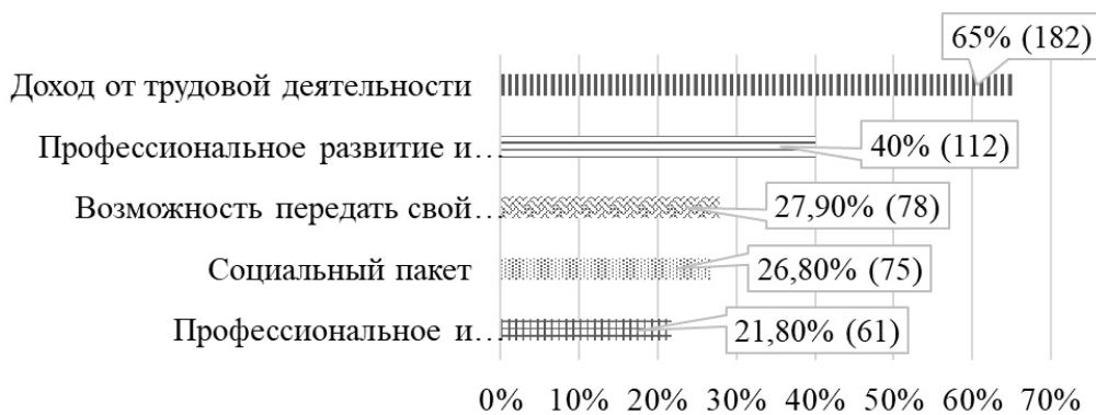
Рис. 3. Ответы на вопрос «Что является для Вас наиболее важным при осуществлении трудовой деятельности?» Fig. 3. Answers to the question “What is most important for you when working?”

передвижение в муниципальном образовании. Поэтому данная категория граждан продолжает работать даже после выхода на пенсию — это является дополнительным доходом и прибавкой к пенсии. Данный факт подтверждают результаты ответов на следующий вопрос (рис. 3).