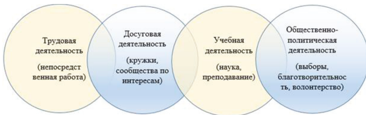
Рис. 1. Виды деятельности пожилых людей Fig. 1. Activities of older people

На основе вышеизложенной информации, можно выделить виды деятельности пожилых людей (рис. 1).