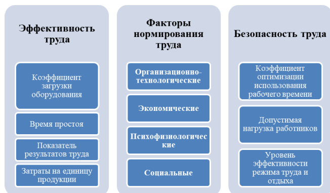
Рис. 3. Схема влияния нормирования труда на эффективность и безопасность труда

томления, стресса и профессиональных заболеваний.