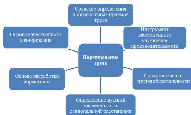
Рис. 2. Роль нормирования труда в системе управления предприятием

тизма, повышению удовлетворенности трудом сотрудников.