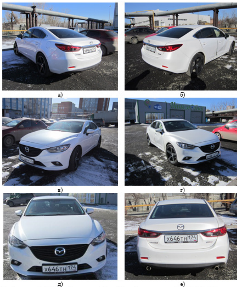
Внешний вид автомобиля Mazda 6 гос. рег. знак Х 646 ТН 174 (далее Mazda 6): а — вид сзади (слева), б — вид сзади (справа), в — вид спереди (слева), г — вид спереди (справа), д — вид спереди, е — вид сзади